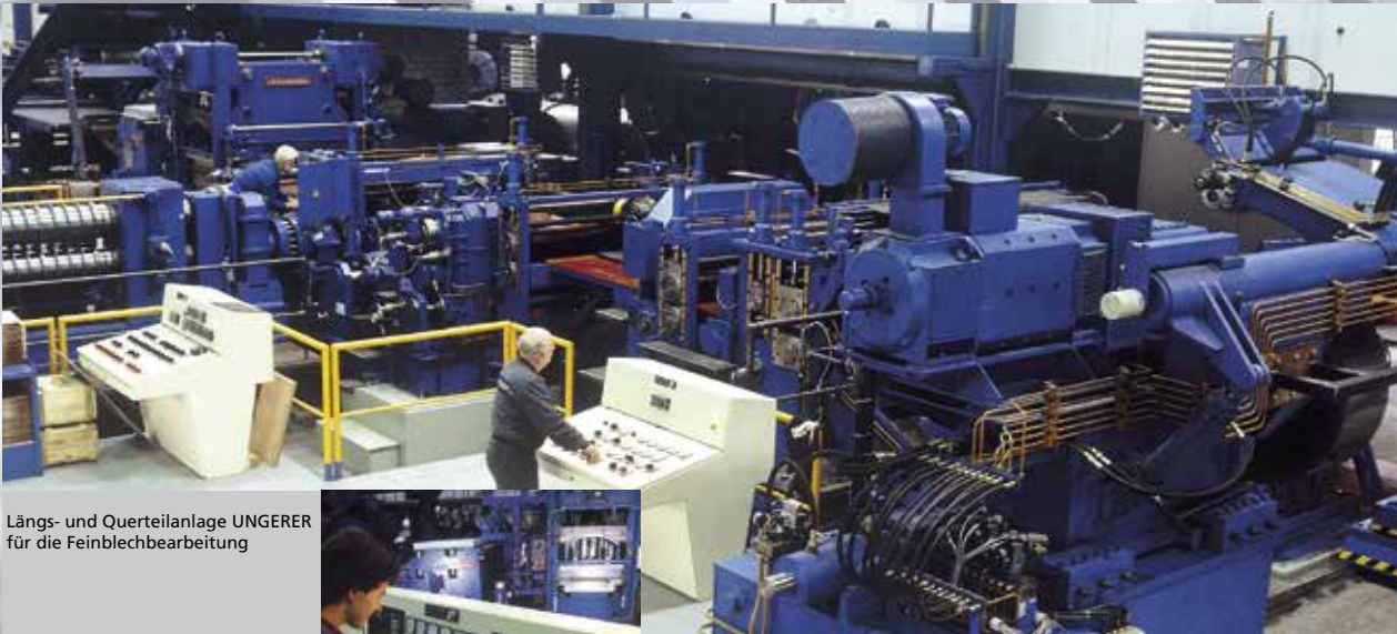
Längs- und Querteilanlage UNGERER für die Feinblechbearbeitung